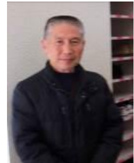
上四公民館 重見館長