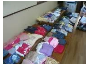
リサイクルバザー