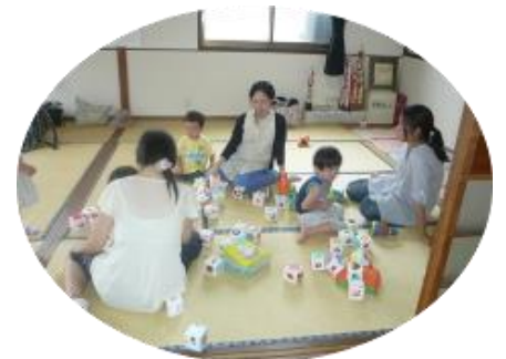
みんなで、遊んだよ!