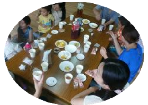
手作りおやつで、おしゃべり