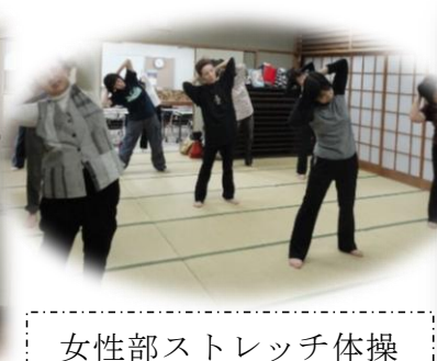
女性部ストレッチ体操