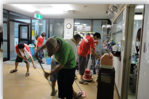
湯町クラブ公民館清掃