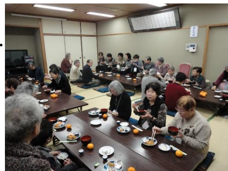
手作りの昼食会は好評

☞課題として、和室で座っての参加が難しくなっており、椅子利用の場所の確保が必要です。