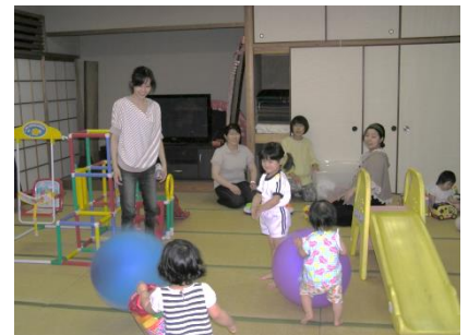
楽しいちびっ子サロン