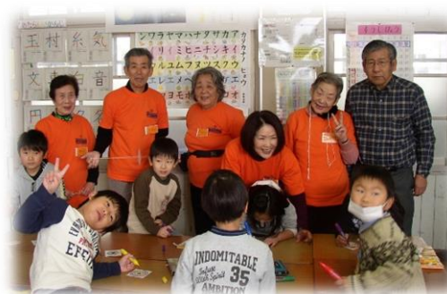
老人会小学校昔遊び