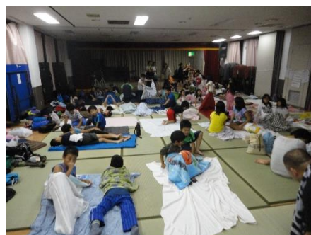
公民館お泊まり合宿

☞会員の増加により公民館が手狭になってきています。見守り活動への参加が少ないのが課題となっています。